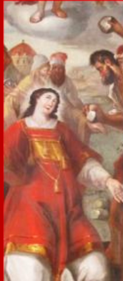
Ausschnitt Altarbild Iffelkofen

Gestern wurde der Herr auf Erden geboren,