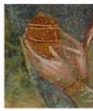
Bild: Stefan Anzinger 2010 (Fresco in San Flaviano, Montefiascone)