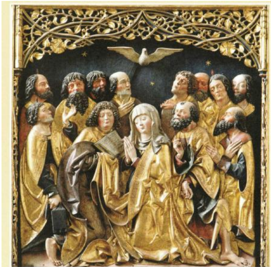
„Pfingstwunder“, ev. Stadtkirche St. Johannes u. St. Martin, Schwabach